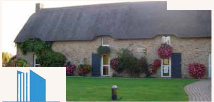
BIBLIOTHEQUE POUR TOUS

« Mon auteur m'imagine et m'écrit. Il m'envoie chez son éditeur... qui le lit. Et le transmet à un imprimeur. Celui-ci, après l'avoir imprimé, le dépose chez son distributeur. Là, j'arrive chez le libraire.