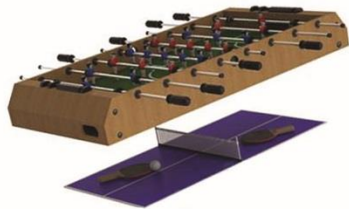
Tournoi baby-foot / billard...