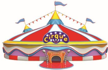
Jeu de piste

Spectacle Cirque présenté par Les Frères Stey.